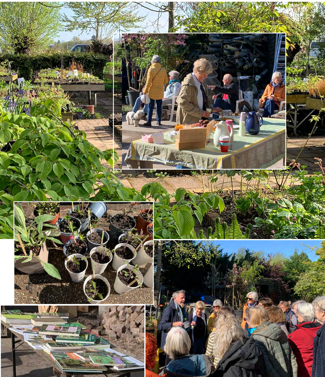
Mooi weer, planten, stekken, boeken, koffie, thee, gebak en veel 'plantenpraat' op de ruilmarkt.